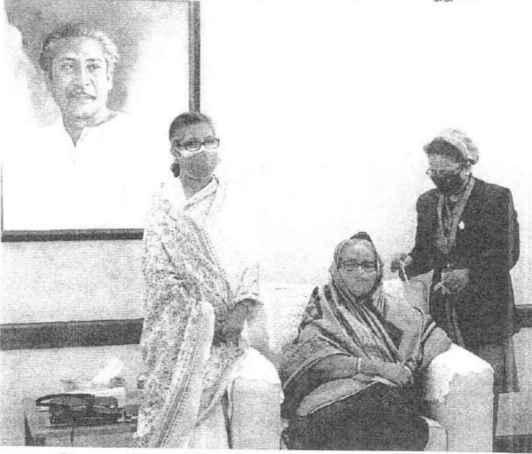
প্রধানমন্ত্রী শেখ হাসিনা কোভিড-১৯ এর টিকা গ্রহণ করেন। এ সময় তাঁর ছোট বোন শেখ রেহানা উপস্থিত ছিলেন (বৃহস্পতিবার, ৪ মার্চ ২০২১)।