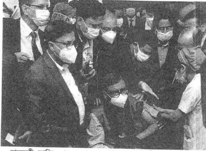
স্বাস্থ্যমন্ত্রী জাহিদ মালেক ঢাকায় শেখ রাসেল জাতীয় গ্যাস্ট্রোলিভার ইনস্টিটিউট ও হাসপাতালে কোভিড-১৯ টিকা গ্রহণ করেন (রোববার, ৭ ফেব্রুয়ারি ২০২১)।